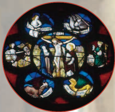
Christ en croix © MV