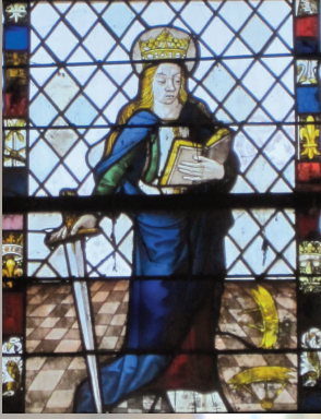
Ste Catherine