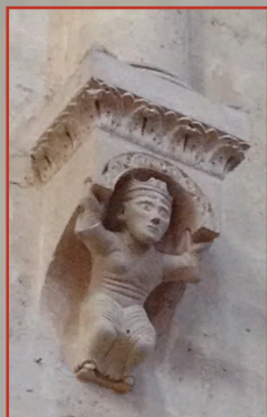
Sainte Fare