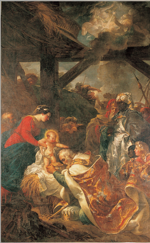
Adoration des Mages, 1768, Gabriel-François Doyen Eglise de Mitry-Mory; Seine-et-Marne